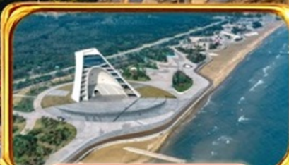
หาดอวยกาลเวลา