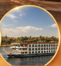
ล่องเรือแม่น้ำไนล์