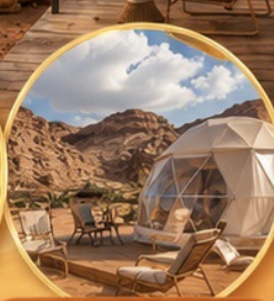
แคมป์กลางทะเลทราย