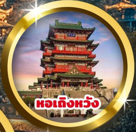
หอเถิงหวัง