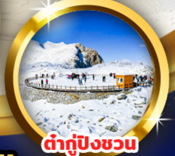
ต่ากู่ปิงชว่น