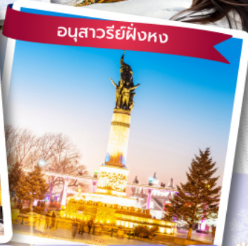
อนุสาวรีย์ผึ้งหง