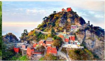
อุทยานเขาบู๊ต้ง

*ทางบริษัทฯ ขอสงวนสิทธิ์ในการสลับโปรแกรมทัวร์ตามความเหมาะสมขึ้นอยู่กับสถานการณ์หน้างาน โดยคำนึงถึงผลประโยชน์ของลูกค้าเป็นสำคัญ