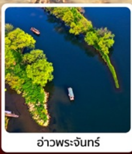
อ่าวพระจันทร์

• ไช้โล่กั เชีคอิน ลั้วซิงตุน หอคอยดาวตกแห่งเสีียงซี หุบเขาวังเซียนกู่ ดินแดนสวยดุจเทพนิยาย