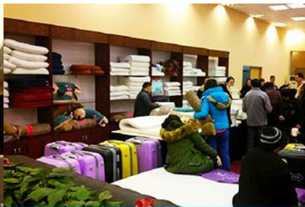
ศูนย์จำหน่ายผลิตภัณฑ์ยางพารา