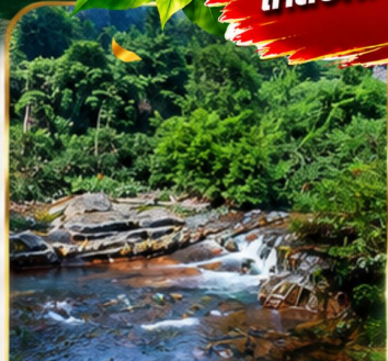
อุทยานฟ่งเลี่ยนซี