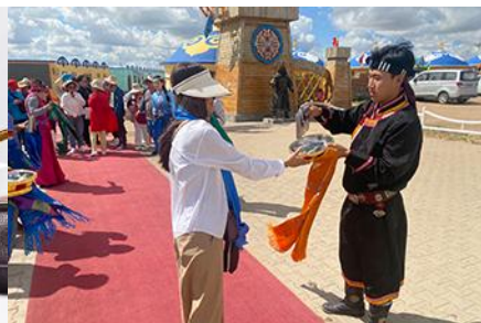
พิธีต้อนรับแขกด้วยเหล้า