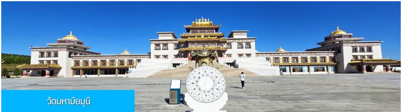
วัดหามัยมุณี

หลังอาหารเช้าท่านเที่ยวชม สวนวัฒนธรรม หมงกู่หยวนหลิว 蒙古源流 เป็นอุทยานท่องเที่ยวเชิงประวัติศาสตร์และวัฒนธรรมระดับ 4A ของจีน ที่เป็นต้นกำเนิดของชนชาติและวัฒนธรรมมองโกล สะท้อนความเป็นจักรวรรดิที่ยิ่งใหญ่เมื่อ 700 ปีก่อน ชม ประตูงเทียน 崇天门 สุนัขโพนารที่แสดงถึงความยิ่งใหญ่ของจักรวรรดิมองโกล ชม พระราชวังหมิงจำลอง 大明殿 ที่สร้างขึ้นเพื่อใช้เป็นสถานที่ประกอบพิธีสำคัญของราชวงศ์หยวน ชม จัตุรัสเถิงเก้อหลี่ 腾格里广场 จัตุรัสกลางแจ้งขนาดใหญ่ที่ใช้ประกอบพิธีกรรมต่าง ๆ