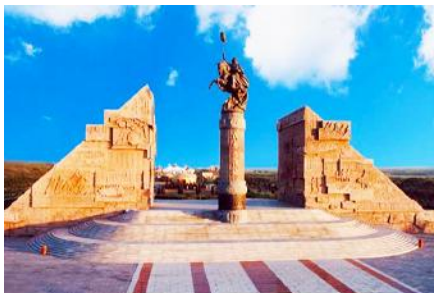
อุทยานก่อกว่ยเจกิสข่าน