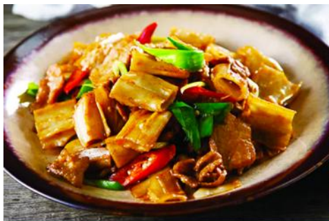
ถนนคนเดินเออร์ดอส

จากนั้นนำท่านเที่ยวชม อุทยานคังปาสือ 康巴什景区 เป็นเขตเมืองใหม่ที่ถูกเนรมิตรขึ้นและได้รับการขึ้นทะเบียนเป็นอุทยานท่องเที่ยวระดับ 4A และเป็นศูนย์กลางความเจริญของเมืองเออร์ดอส ประกอบด้วยจัตุรัส ธีมปาร์ก พิพิธภัณฑ์ แกรนด์เธียร์เตอร์ ศูนย์วัฒนธรรม และสนามแข่งรถนานาชาติ นำท่านนั่งรถผ่านชมจัตุรัสรัฐบาล ทะเลสาบอุหลันมู่ สวนศิลปะงานปาดิมากรรมเอเชีย ฯลฯ