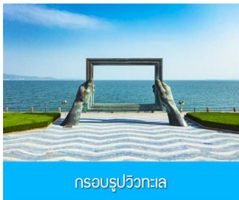
กรอบรูปวิวกทะเล