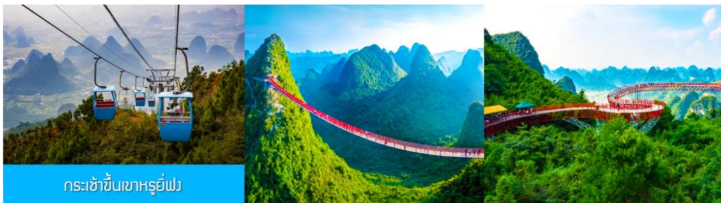
กระเช้าขึ้นเขาหุ้ยฟ่ง