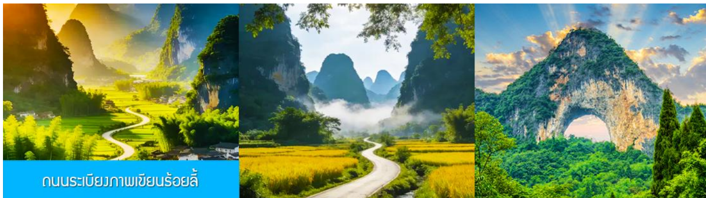
ถนนระเบียบภาพเขียนร้อยลี้

จากนั้นนำท่านเดินทางสู่ เมืองหยางชว่ 阳朔 (ระยะทาง 80 กม. ใช้เวลาเดินทาง 1 ชั่วโมง)