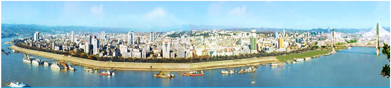
เมืองหยีฉาง

- เที่ยวเต็มสุข ไม่ต้องเร่งรีบเข้าร้านช้อปปิ้งบังคับ - บินกลางวัน ไม่อดนอนเหมือนเที่ยวบินกลางคืน - โปร่งใสน่าเชื่อถือ ไม่มีค่าใช้จ่ายซ่อนเร้น - ไม่เก็บทิปก่อนเที่ยว เพราะมั่นใจในคุณภาพ