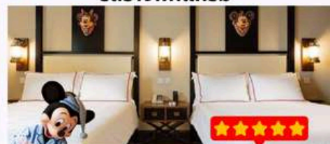
พัก Disney Explorers Lodge 5 ดาว 1 คืน