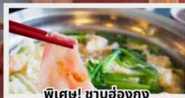
พิเศษ! ชาบูฮ่องกง