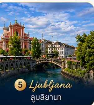
5 Ljubljana ลูบลิยานา