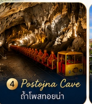
4 Postojna Cave ถ้ำโพสทอยน่า