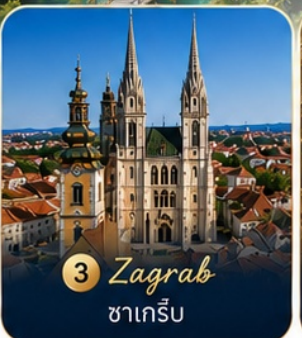
3 Zagreb ซาเกร็บ