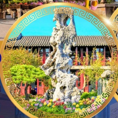
สวนหลิวหยวน

ถนนหนานจิงหลู่ หาดไว่ทาน ชมหอไข่มุก ล่องเรือทะเลสาบซีหู ดำน้ำตื้นชายหาด เจดีย์เหลยเฟิง ถนนเลี้ยวเหอจื่อเจีย วัดหลงหยวน สวนหลิวหยวน ซุปป์ปิ้ง ถนนกวนเจียนเจีย ถนนซีหลี่ซานถึง วัดพระหยก เซคอินย่านเก่าซิ่นเทียนตี้ สักการะศาลเจ้าพ่อหลีกเมือง