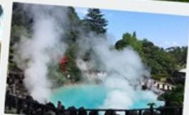
บ่อน้ำพุร้อน เปรปุ

หมู่บ้านยูฟูอินฟลอร์ริล ทะเลสาบคินริน ทะเลสาบคินริน บ่อน้ำพุร้อน อุมิจิโกกุ ท่าเรือโมจิโกะ เรโร ตลาดปลาอาราโตะ ศาลเจ้ามียาจิดาเกะ ดิวัตตีฟรี ฟุกุโอกะ เบย์ พลาซ่า ช้อปปิ้งออน มอลล์ หิ้งคูเมโอโตะอิวะ ชมดอกไม้ไฮเดรนเยีย รอบน้ำตกชิราอิโตะ ช้อปปิ้งย่านเท็นจิน