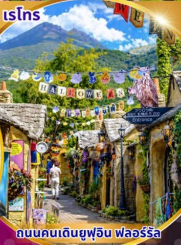
ถนนคนเดินยูฟูอิน ฟลอร์ริล