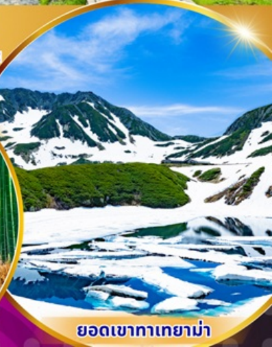
ยอดเขาทาเกยาม่า

พักรีสอร์ท 3 ดาว ★★★★★ ฟรี ประกันอุบัติเหตุ บริการอาหารท้องถิ่น