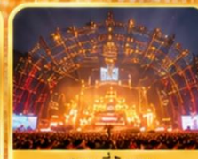
สถานที่จัดงาน เทศกาลเบียร์ชิงเต่า