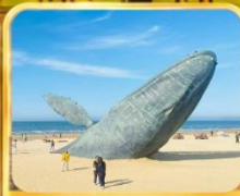
ประติมากรรมวาฬไทยตัน