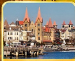
ท่าเรือชาวประมง