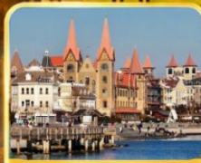
ท่าเรือชาวประมง