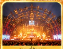
สถานที่จัดงาน เทศกาลเบียร์ชิงเต่า