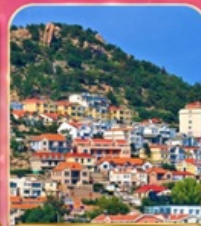
หมู่บ้านชาวประมงซาโจ่วโหว่