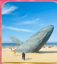
ประติมากรรม "วาฬผู้โดดเดี่ยว"