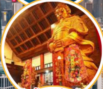
ไหว้พระวัดดั่ง