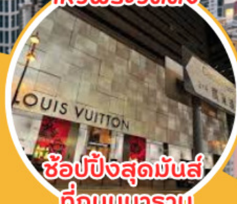
ช้อปปิ้งสุดมันส์ ที่ถนนนคราณ