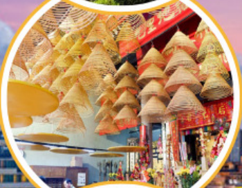
ไหว้พระวัดตั้ง