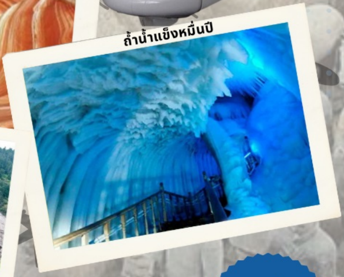
ถ้ำน้ำแข็งหมื่นปี