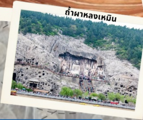
ถ้ำผาลงเหมิน