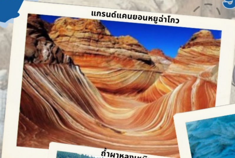
แกรนด์แคนยอนหยูฉ่าโกว