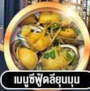
เมนูซีฟู้ดลิขุมบุน