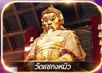
วัดเชกงหวี