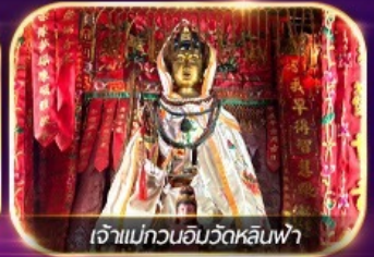
เจ้าแม่กวนอิมวัดหลินฟ้า

เต็มอิ่มทั้งบุญ และ ซ้อมปิ้งแบบจัดเต็ม จิมซาจุ่ย มงก๊ก