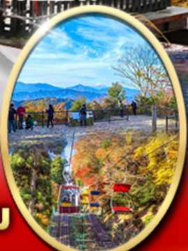
ภูเขา ทาคาโอะ

รหัสทัวร์ RJ-XJ127 เดินทาง 6D 4N กันยายน - พฤศจิกายน 69