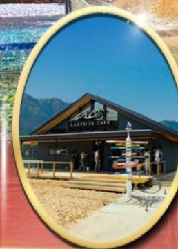
Ao Lakeside Cafe