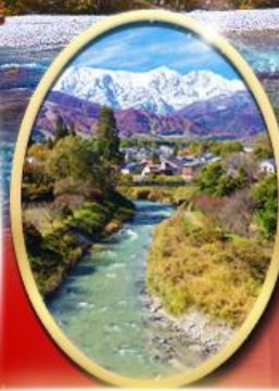
โออิเดะพาร์ค