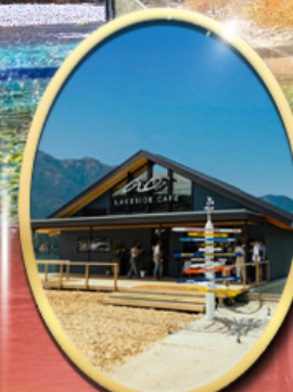
Ao Lakeside Cafe