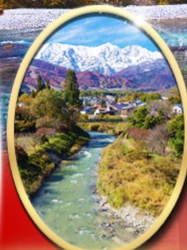
โออิเดะพาร์ค