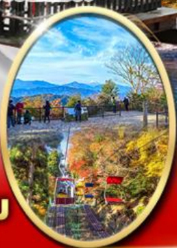
ภูเขา ทาคาโอะ

ปราสาทดสิโมโต้ Starbuck Snow Peak Land วัดชินโซจิ