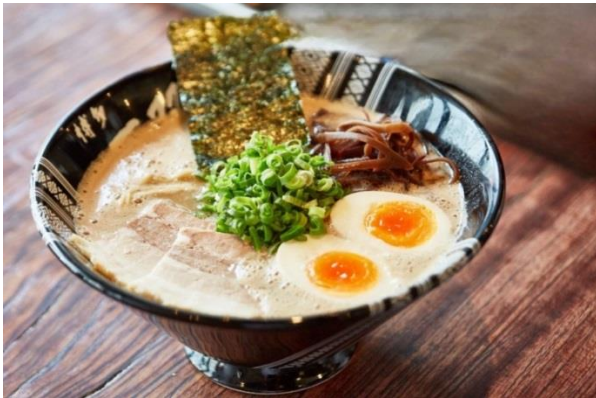
ฮาากาตะระเมง (Hakata Ramen)