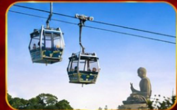
กระเช้านองปิง