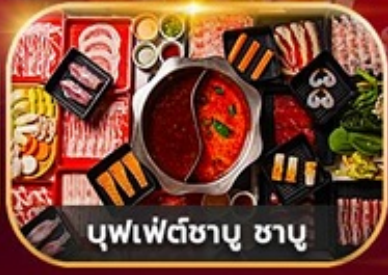
บุฟเฟ่ต์ชาบู ชาบู