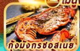
กุ้งมังกรชอสนาย