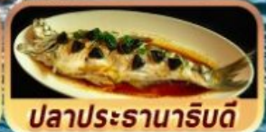
ปลาประจานาริบดี