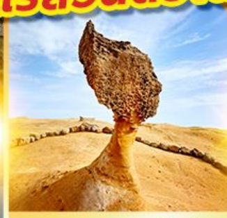
อุทยานหินเหย่หลิว