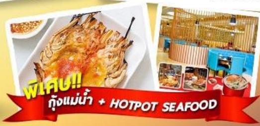
พิเศษ!! กุ๊งแม่น้ำ + HOTPOT SEAFOOD