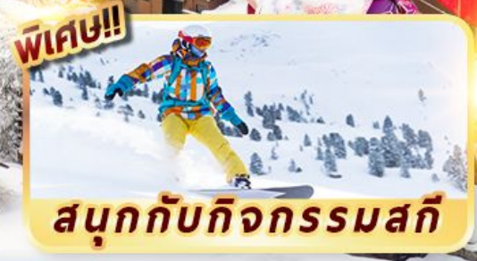
สนุกกับกิจกรรมสกี