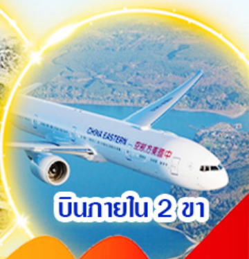
บินภายใน 2 ชม