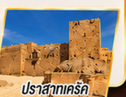
ปราสาทเคิร์ค