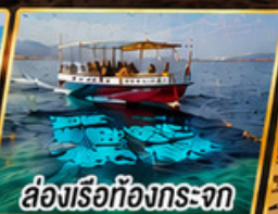
ล่องเรือท้องกระจก