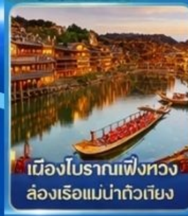
เมืองโบราณเฟิงหวง ล่องเรือแม่น้ำถั่วเจียง