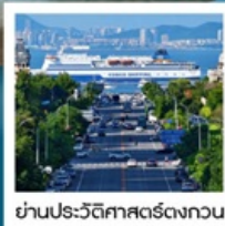
ย่านประวัติศาสตร์ตงกวน

Fisherman's Wharf • จัตุรัสชิงไห่ (รวมรถราง) • ถนนตงกวน • เวนิสแห่งต้าเหลียน • ถนนรัสเซีย