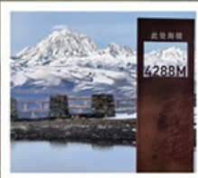
ปาหลางดิงตู