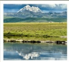
ดวงตาแห่งต่ำถาง