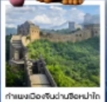
กำแพงเมืองจีนผ่านซือหม่าโต

เมืองโบราณกู่เป่ย์สุ่ยเจิน / กำแพงเมืองจีนด่านซือหม่าโต (รวมค่ากระเช้าขึ้น-ลง) / ชมวิวกำแพงเมืองจีนและเมืองโบราณ ยูนิเวอร์แซลปักกิ่ง (รวมค่าบัตรเข้า) / จตุรัสเทียนอันเหมิน / พระราชวังโบราณฤดูร้อน / หอบูชาเทียนถาน คาเฟ่กาแฟบ้านน้ำตาด (TANG FANG CAFE) / พระราชวังฤดูร้อนอวิ๋เหอหยวน / ย่านชานหลี่ถุน (POP MART) / ถนนคนเดินไท่กุ่หลี่