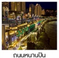
ถนนหนานปิ่น