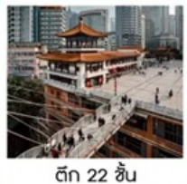
ตึก 22 ชั้น