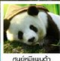
ศูนย์อนุรักษ์แพนด้า