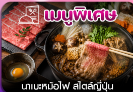
เมนูพิเศษ นาเบะคินอิโง สัตสึเมะ