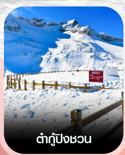
ต้ากู่ปิงชอน