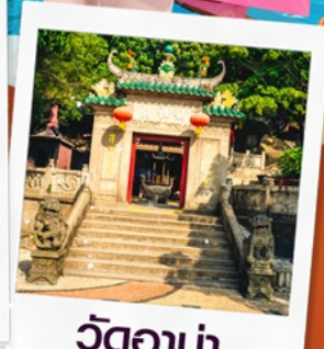
วัตอาม่า