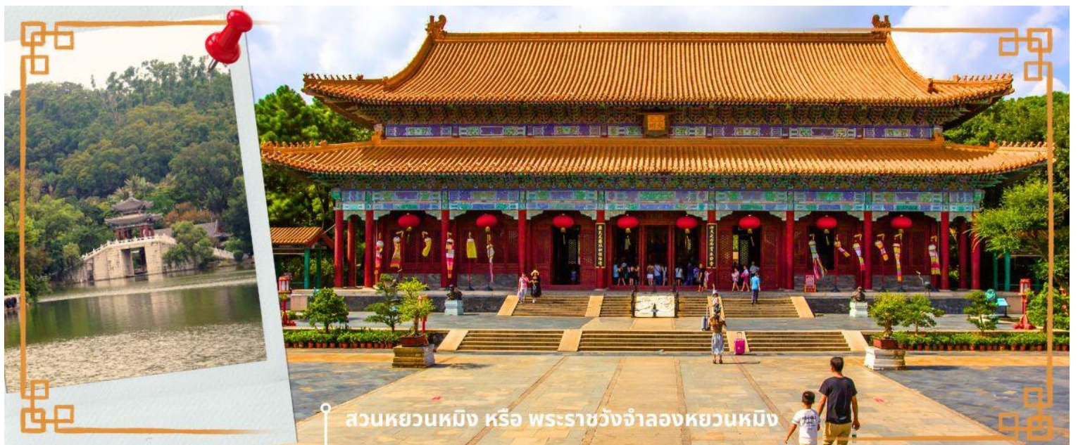
สวนหยวนหมิง หรือ พระราชวังจำลองหยวนหมิง

จากนั้นนำท่านสู่ ร้านหยก หยกในจีนโบราณจนมาถึงสมัยนี้ ยังมีความเชื่อว่าเป็นอัญมณีที่ล้ำค่าและหายาก บ่งบอกฐานะของสตรีในสมัยก่อน แต่ในสมัยนี้ เชื่อกันว่าหยกสีเขียวนั้นเหนียวนาโชคและความร่ำรวย ดังคำกล่าวที่ว่า“สีเขียวเหนียวทรัพย์” ถือเป็นการเสริมดวงจัญที่ดีของผู้สวมใส่อิสระให้ท่านได้เรียนรู้ชนิดของหยกและเลือกซื้อตามใจชอบจากนั้นนำท่านสู่ สวนหยวนหมิง หรือ พระราชวังจำลองหยวนหมิง ตั้งอยู่ ณ ใจกลางหุบเขาซีลिन เมืองจูไห่ สร้างขึ้นเลียนแบบพระราชวังหยวนหมิง ณ กรุงปักกิ่ง สิ่งก่อสร้างต่างๆ มากกว่า 100 ชิ้น มีขนาดเท่าของจริงในอดีตทุกชิ้น อาทิ เสาหินคู่ สะพานข้ามธารทอง ประตูต่างๆ ตำนกเจิ้งตำกวางหมิง สะพานเก้าเหลี่ยม สวนแห่งนี้โอบล้อมด้วยขุนเขาที่เขียวชอุ่ม และมีพื้นที่ครอบคลุมทะเลสาบขนาดมหึมา ซึ่งมีขนาดเท่ากับสวนเดิมในกรุงปักกิ่ง และยังมีการเพิ่มเติมและตกแต่งสวนที่เป็นศิลปะแบบตะวันตกผสมกับศิลปะจีน