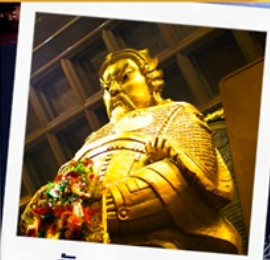
วัดเขกงหมิว