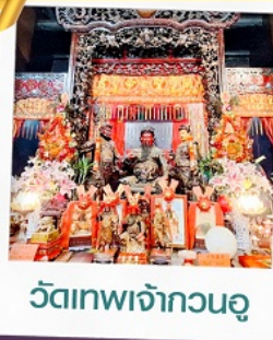
วัดเทพเจ้ากวนอู