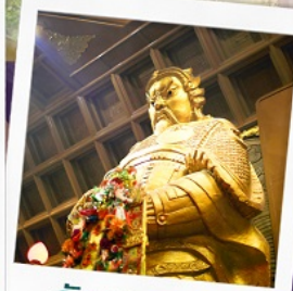
วัดเขาแกงหมิว