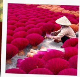
หมู่บ้านรูป