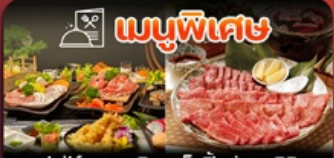
บุฟเฟ่ต์นาซาคิ เซ็ตบั้งย่างยากิโทกุ

ฟุกุโอกะ-วัดนินโซอิน-หมู่บ้านยูฟูอิน-แบบบุ-บ่อนรกจิกุ-แซ่ออนเซ็น-ช้อปบั้งเทนจิน-พักใกล้แหล่งช้อปบั้ง2คืน