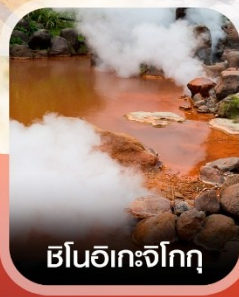
ฮินอเกาะจิกุกุ

✈️ คอนเฟิร์มออกเดินทาง ✈️ ทุกพีเรียด 2 ท่านขึ้นไป