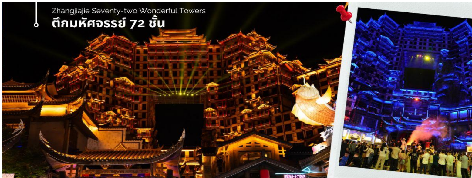
Zhangjiajie Seventy-two Wonderful Towers ตึกมหัศจรรย์ 72 ชั้น

จากนั้นนำทุกท่าน ชมวิวตึกมหัศจรรย์ 72 ชั้น จุดเช็คอินใหม่ล่าสุดของเมืองจางเจียเจี๋ย โดยการสร้างตึกในครั้งนี้เป็นการรวมเอาจุดเด่นของเมืองจางเจียเจี๋ยกับวัฒนธรรมการสร้างบ้านเรือนของชาวพื้นเมืองถู่เจียมารวมกันโดยอาคารสูงที่สร้างจำลอง เขาเทียนเหมินซานหรือประตูสวรรค์ และ บ้านยกพื้นโบราณที่เป็นบ้านพื้นเมืองของชาวถู่เจีย ภายในบริเวณตึก 72 ชั้น ยังรวบรวม รีสอร์ท ร้านอาหาร สตรีทฟู้ด ร้านขายของที่ระลึก ที่ตกแต่งด้วยแสงสีสุดอลังการ ตั้งอยู่ใจกลางเมืองจางเจียเจี๋ย