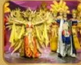
ชมการแสดงโขนจีน