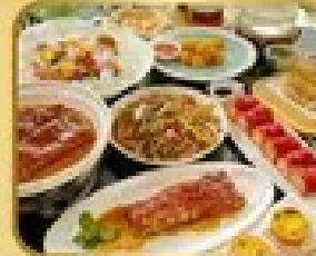
อาหารจีน 5 อย่าง